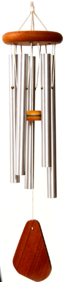
Nicht zu überhören: Windspiele als freundlich-zuverlässige Signalgeber.