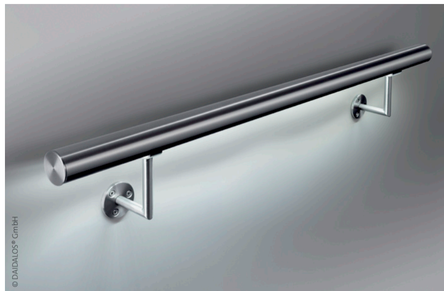
Wegweisend: beleuchteter Handlauf aus Edelstahl.