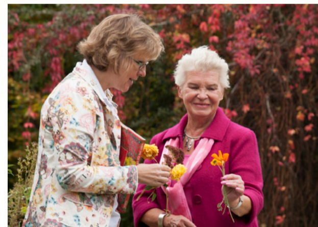
Auszeit im Garten: Lass Blumen sprechen.

ALS AUSDRUCK unserer Wertschätzung setzen wir eine Mitarbeiterin speziell für die Begleitung und Qualifizierung von Freiwilligen ein (siehe Kasten links). Sie leitet unter anderem den Qualifizierungskurs. Hier vermitteln wir spezielle Kenntnisse, die Freiwillige u.a. für die Begleitung von Menschen mit Demenz benötigen. Darüber hinaus