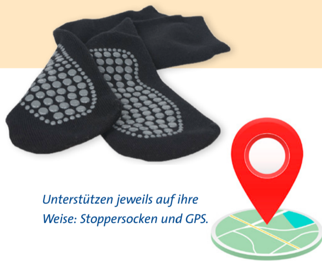
Unterstützen jeweils auf ihre Weise: Stoppersocken und GPS.