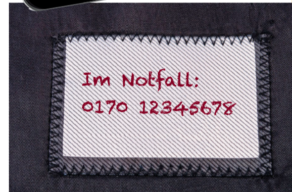
Little Helper für den Notfall: ein aktuelles Foto bereithalten und Infos in die Kleidung einnähen.

DIE GUTE NACHRICHT: Sogenannte körpernahe Fixierungen mit Bändern und Gurten kommen in der häuslichen Pflege eher selten vor. Zum Glück: Es ist nämlich besonders gefährlich, wenn pflegebedürftige oder demenziell verwirrte Personen mit Gürteln, Mullbinden oder Ähnlichem an Stühlen oder im Bett festgebunden sind. Häufiger kommt es vor, dass der pflegebedürftige Mensch zu