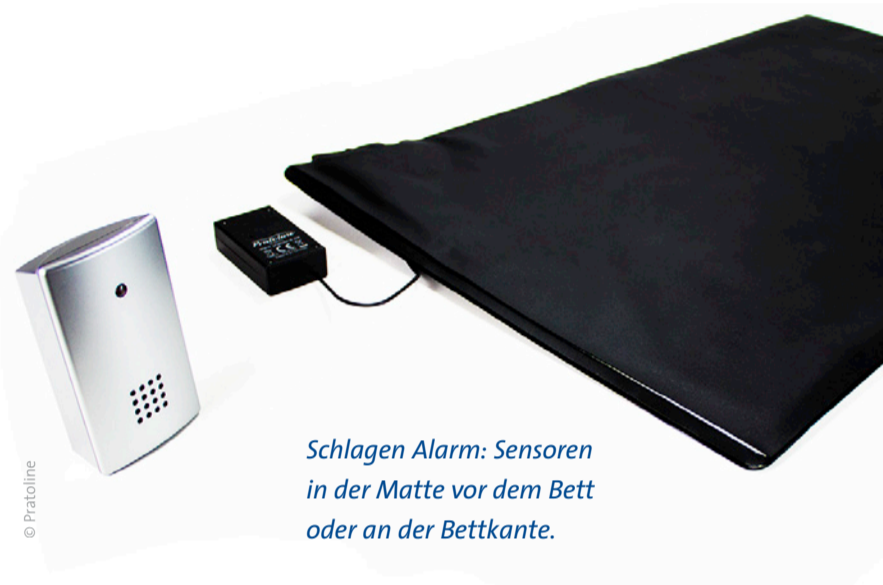
Schlagen Alarm: Sensoren in der Matte vor dem Bett oder an der Bettkante.