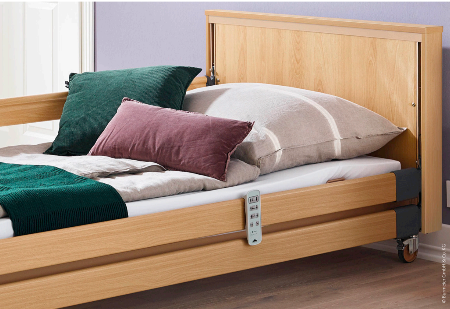
Niedrige Pflegebetten helfen, Stürze zu vermeiden.